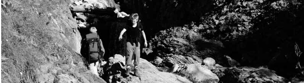
Die Füße und Gelenke machten sich bemerkbar

Spitze und freuten uns einmal auf der Tour an einem Gipfelkreuz zu stehen. Dann ging es aber wieder zurück zur Hirzer Hütte und mit Lift und Bus direkt nach