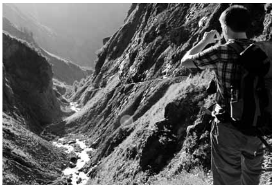
Ein einmaliger Blick ins Tal

Am dritten Tag nahmen wir in Zams den Bus bis Mittelberg. Das Tagesziel, die Braunschweiger Hütte, erreichten wir trotz leichtem Regen pünktlich und hatten endlich auch etwas Zeit, um nach der Wanderung noch zu entspannen und Bonanza zu spielen (unser Tourenspiel).