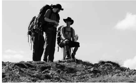
Der Lohn des Aufstiegs

Am sechsten Tag mussten wir uns leider von einem Wanderer verabschieden und in einer kleineren Gruppe auf das Timmelsjoch aufsteigen. Noch immer trübte das Wetter den Wanderspaß ein bisschen. Das Tagesziel Moos erreichten wir dennoch gut und haben in der absolut besten Herberge der Tour übernachtet: dem Mooserwirt. Und wir schlugen uns die Bäuche mit der Nudelpfanne (geschätzte 5 kg Nudeln verteilt auf zwei Pfannen mit